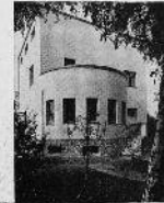
Haus des Bürgermeisters in Wurzen Architekt Albrecht Jaeger, Breslau

First page of Wilhelm Lotz, "Architekturfotos," Die Form (February 1929). Left column: from Bruno Taut, Ein Wohnhaus [1927]. Right column: Albrecht Jaeger, Haus des Bürgermeisters, Wurzen.